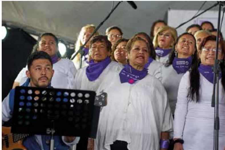
1. Coro de Mujeres Imparables