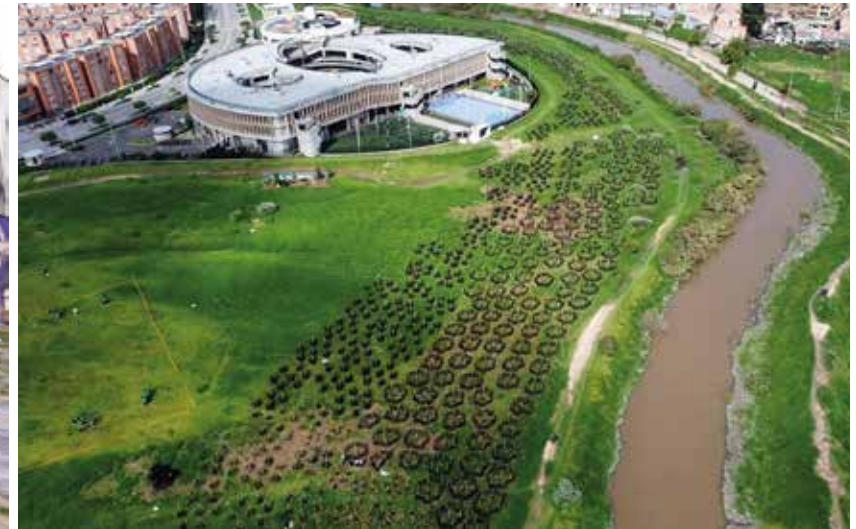
3. 1er Bosque Urbano de Bosa