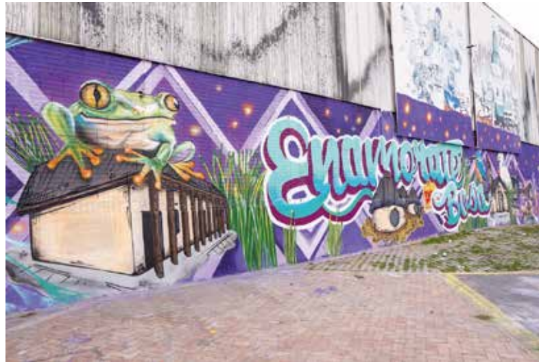
2. Estrategia Descubre y enamórate de Bosa y sus 7 maravillas