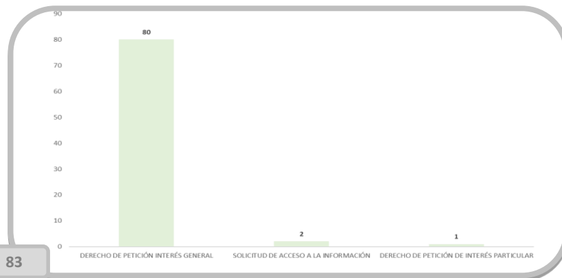
Tipología (Peticiones tramitadas)