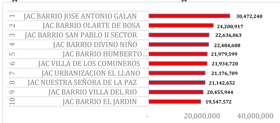
Ilustración 2. Organizaciones con valores más altos a cargo en comodato